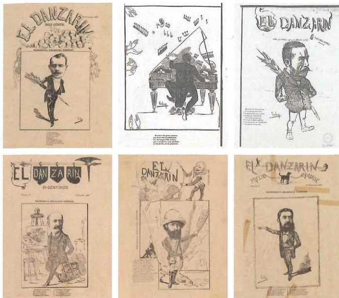
Fundación Sancho el Sabio Fundazioa