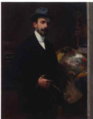
Ignacio Díaz Olano Arabako Arte Ederren Museoaren © argazkia © de la fotografía Museo de Bellas Artes de Álava