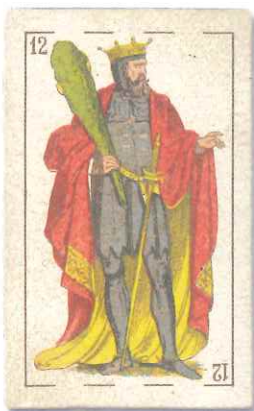
Bastoi-erregea / Rey de Bastos Fournier Karta Museoa AFA Museo Fournier de Naipes DFA