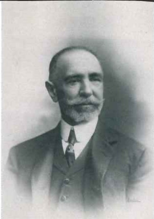
Heraclio Fournier Fournier Karta Museoa AFA Museo Fournier de Naipes DFA